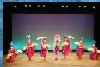
琉球舞踊 はいさい