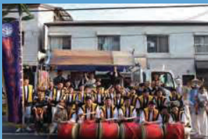
鶴見エイサー潮風 (11/2)