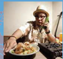
DJ Sasa feat. 金城美織 (11/3) (green note coaster)