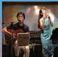
学園前 Duo (11/3)