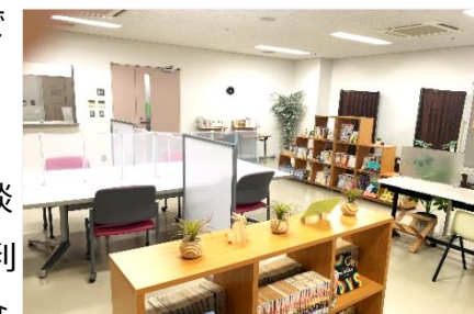
▲心理学の本やマンガも読めるほっとスペースの様子

金沢八景キャンパスには、静かな環境でリラックスするための「ほっとスペース」が併設されています。学内の喧騒から離れ、授業の合間に一息入れる場所として、特に相談したいことがなくても、多くの学生が気軽に利用しています。空き時間に自習をしたり、食事を取ることもできます。