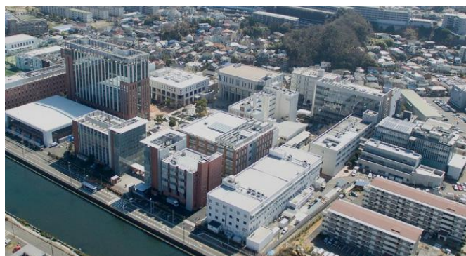
金沢八景キャンパス